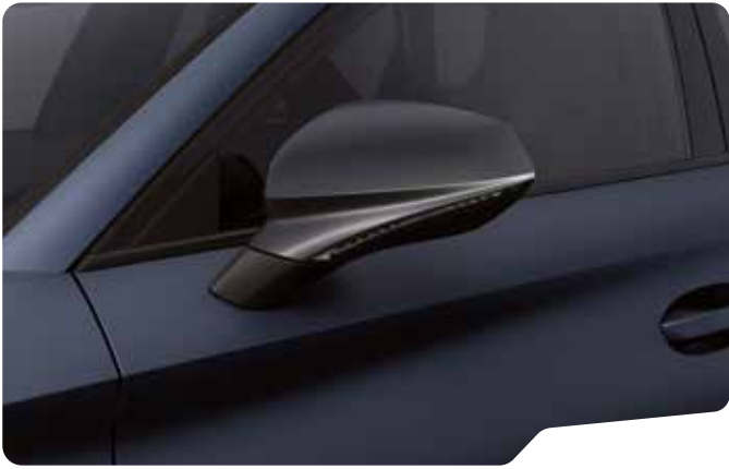
↓ PETROL BLUE MATTE