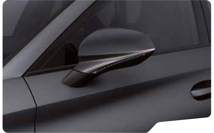
↓ MAGNETIC TECH MATTE