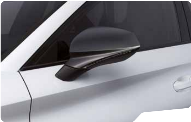
↓ NEVADA WHITE