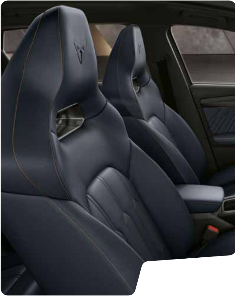
↑ PETROL BLUE LEATHER □