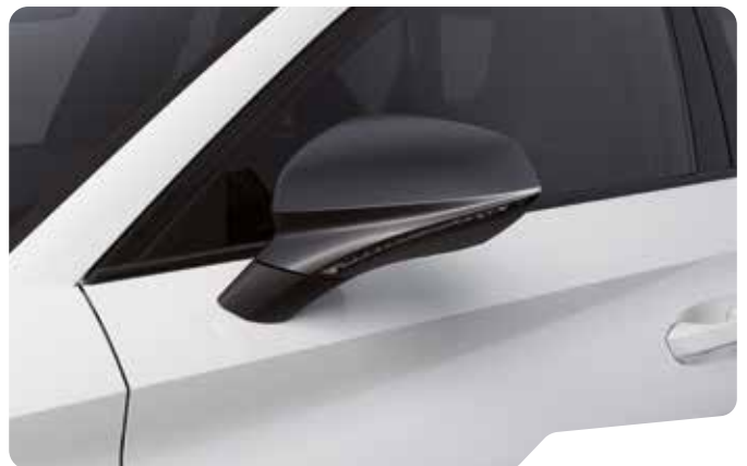
↓ CANDY WHITE